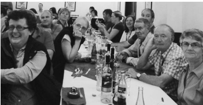
Účastníkov zaujalo folklórne vystúpenie