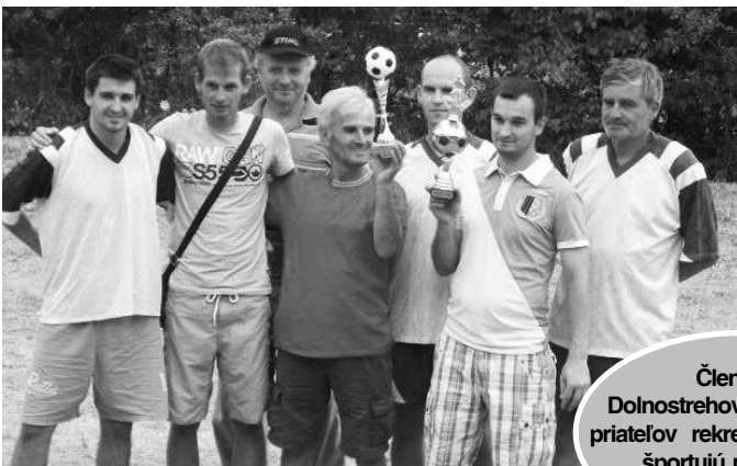
Členovia Dolnostrehovského Klubu priateľov rekreačného športu športujú pre radosť a utuženie zdravia