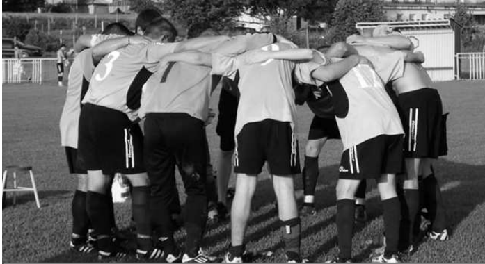
Víťazné pokriky lesenických futbalistov po vyhratých zápasoch