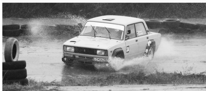
Peťo Ďurkovič už v extrémnych podmienkach

jednej trati a do výsledkov sa započítal len najrýchlejší čas.