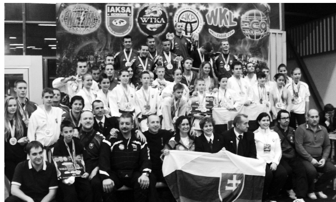
Výprava Slovenskej federácie karate a bojových umení MS WTKA