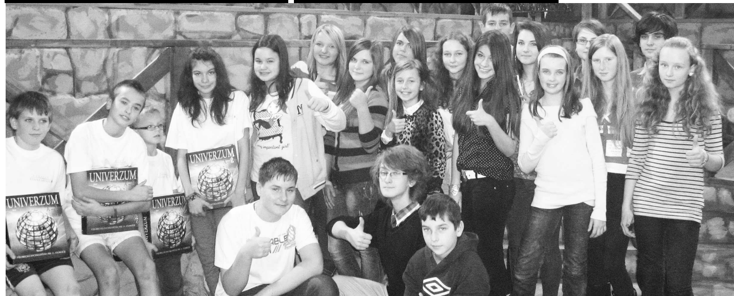
Súťažiaci a perfektné publikum na scéne hradu grófa Zloducha