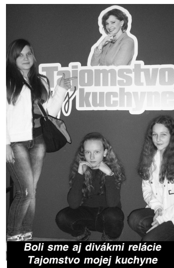
Bolí sme aj divákmi relácie Tajomstvo mojej kuchyne