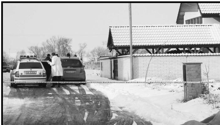
Ohliadajúci lekár na mieste činu zistil, že príčinou smrti sú pravdepodobne bodnorené rany, ktoré boli na krku a hrudi nebohej ženy