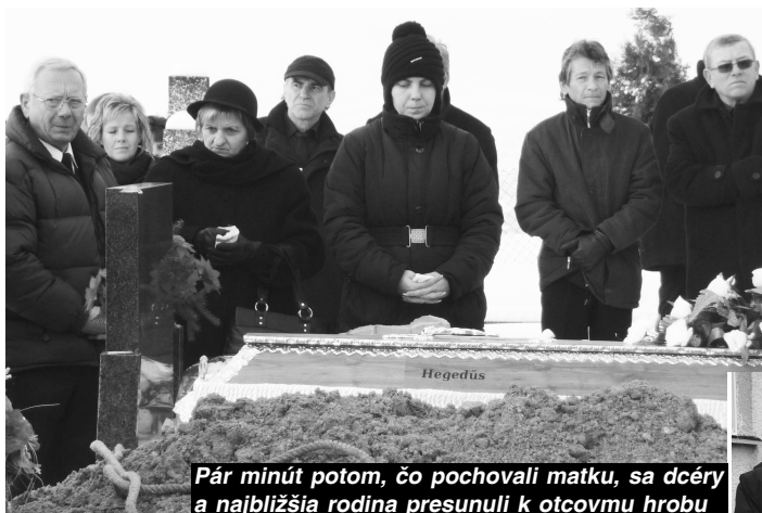
Pár minút potom, čo pochovali matku, sa dcéry a najbližšia rodina presunuli k otcovmu hrobu