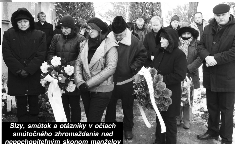
Slzy, smútok a otázky v očiach smútočného zhromaždenia nad nepochopiteľným skonom manželov

Po smútočnej svätej omši a poslednej rozlúčke v dome smútku preniesli rakvy s pozostatkami nebohých k dvom osobitne vykopaným hrobom. Že manželov nepo-