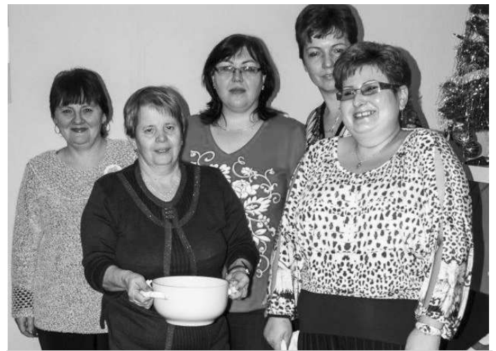
Najmladšie členky ZO JDS - vždy ochotné pomôcť