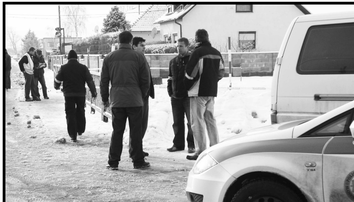
Na miesto tragédie prišli kriminalisti z celého okresu i z Krajského riaditeľstva PZ v B. Bystrici