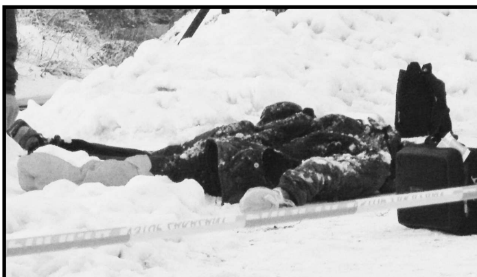
Telo mŕtveho muža ležalo vo vode pravdepodobne niekoľko hodín a na breh ho museli vytiahnuť hasiči